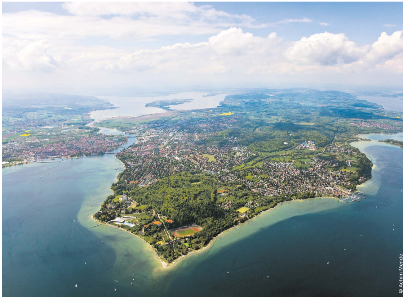
Im aktuellen Klimaschutzbericht benennt das Amt für Klimaschutz Vorschläge, wie sich die Lücke zwischen Anspruch und Wirklichkeit im Klimaschutz verkleinern ließe.

Kommunaler Klimaschutz ist in Deutschland derzeit keine gesetzliche Pflichtaufgabe. Dennoch sind Konstanz und andere Kommunen in Baden-Württemberg zu einer Reihe klimabezogener Maßnahmen verpflichtet: Dazu gehören die kommunale Wärmeplanung sowie die jährliche Energieverbrauchserfassung der kommunalen Gebäude. Zudem schreibt die europäische Gebäude-