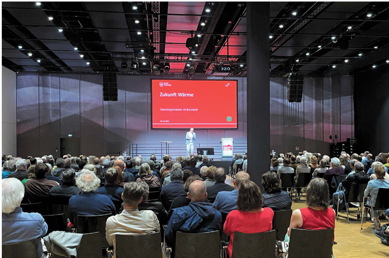
Zahlreiche Interessierte waren der Einladung von Stadt und Stadtwerken gefolgt, um sich zur Wärmeversorgung in Konstanz zu informieren und in den Austausch mit ExpertInnen zu kommen.