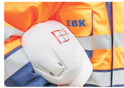
Für den Kanalanschluss des Bückleparks wird von 10. bis 12. Juli 2026 Schienenersatzverkehr eingerichtet.

Auf dem Bücklepark entstehen in den nächsten Jahren insgesamt 760 neue Wohnung. Diese Wohnungen müssen an das Kanalnetz angeschlossen werden. Die zugehörigen Arbeiten haben im Juli Auswirkungen auf Bahn- und Radverkehr: Von 06. bis 17. Juli gibt es eine Umleitung des Bodensee-Radwegs und von 10. bis 12. Juli Schienenersatzverkehr.