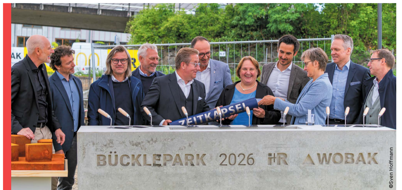
Am 10. Juni 2026 wurde der Grundstein für 198 WOBAK-Wohnungen auf Cluster D des Bückleareals gelegt. Die Wohnungen richten sich an Menschen mit niedrigem und mittlerem Einkommen. 169 der Wohnungen sind für Haushalte mit Wohnberechtigungsschein vorgesehen. Die Wohnungen können voraussichtlich ab 2029 bezogen werden. Es handelt sich um das größte Einzelprojekt der WOBAK seit mehr als 50 Jahren. V.l.: Bürgermeister Karl Langensteiner-Schönborn, Markus Burtscher (Bereichsleiter i+RB Industrie- und Gewerbebau), Reinhard Schertler (Geschäftsführender Gesellschafter i+R-Gruppe), Joachim Alge (Geschäftsführender Gesellschafter i+R-Gruppe), WOBAK-Geschäftsführer Jens-Uwe Götsch, Oberbürgermeister Uli Burchardt, Theresa Schopper (Ministerin für Landesentwicklung und Wohnen Baden-Württemberg), Mario Bischof (Geschäftsführer i+RB Industrie- und Gewerbebau), Dr. Iris Beuerle (Verbandsdirektorin vbw Verband baden-württembergischer Wohnungs- und Immobilienunternehmen), Michael Moser (Leiter Projektentwicklung WOBAK) und Daniel von Bischopink (Technischer Leiter WOBAK).