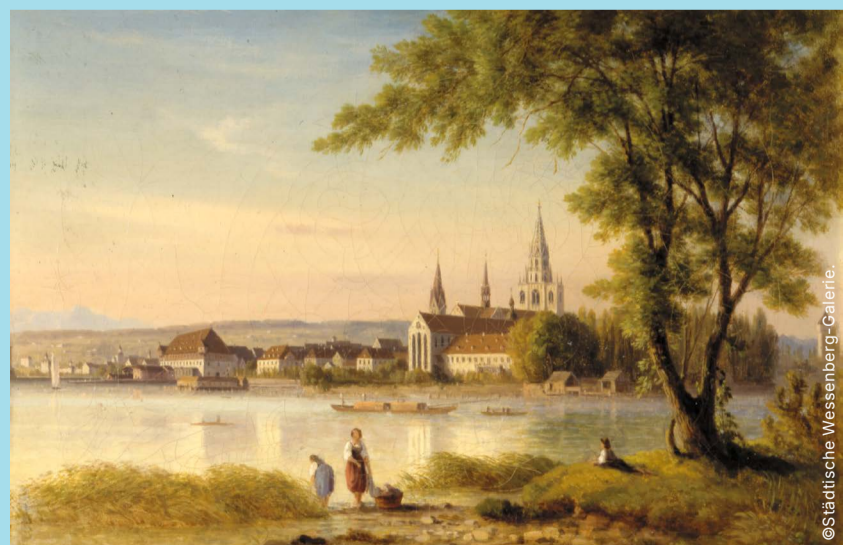
Joseph Mosbrugger: Blick auf Konstanz von der Seestraße aus, Öl auf Leinwand, ohne Jahr.

Diese und viele weitere Landschaftsmalereien von Joseph Mosbrugger sind bis zum 10. Januar 2026 in der Ausstellung „Die Mosbrugger. Eine Künstlerfamilie am Bodensee“ im Rosgartenmuseum zu entdecken.