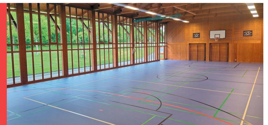
Die Thingolthalle in Dingelsdorf hat einen neuen Sportboden. Auf der Fläche von 420 m 2 ist ein moderner und sicherer Belag mit Spielfeldmarkierungen für Basketball, Volleyball und Badminton sowie mit Kleinfeldern für Handball und Fußball entstanden. Dazu sind neue Bodenrillen für das Hülsenreißer, neue Bodenrillen sowie erneuerte Hülsen für Volleyball- und Badmintonanlagen gekommen. Auch der Unterboden wurde erneuert. Zudem wurden die Bodenbeläge in den beiden Geräteräumen saniert.