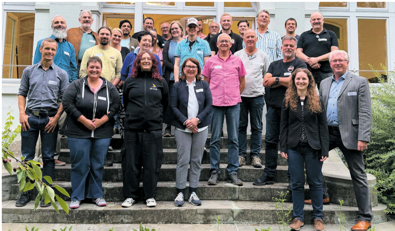
Im Rahmen der Engagementförderung setzt die Stadt das Qualifizierungsangebot „Vereinsführerschein“ um.

Die Qualifizierungsreihe wird im Rahmen des städtischen Fortbildungsprogramms „Fit im Ehrenamt“ in Kooperation mit Michael Blatz Unternehmens- & Vereinsberatung durchgeführt. Die Auftaktveranstaltung fand am 09. Juni in der Villa Rheinburg statt. Zum ersten Modul „Vereinsmanagement“ kamen Verantwortliche aus Sport-, Bildungs-, Fasnachts-, Gesellschafts- und Kulturvereinen zusammen. Frisch gegründete Vereine waren ebenso vertreten wie traditionsreiche Vereine. Einige Teilnehmende haben ihre Vorstandsämter erst seit einigen Monaten inne, andere bereits seit Jahrzehnten. Vielfältig waren auch die Gründe zur Teilnahme und die Erwartungen an die Fortbildungsreihe: Genannt wurden unter