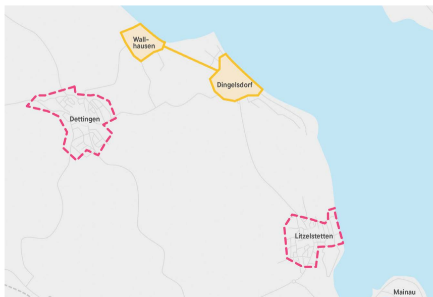
Die Ergebnisse der Planung zum Wärmenetz in Konstanz: Blaue Gebiete sind Priorität-1-Gebiete für den Wärmenetzausbau durch die Stadtwerke, grüne Gebiete sind nachgelagerte Priorität-2-Gebiete. Gelbe Flächen bezeichnen Netze Dritter, etwa das Projekt des Solarkomplex in Dingelsdorf/Wallhausen. Gebiete mit rosa Umrandung haben nach aktuellem Stand keine Aussicht auf ein Wärmenetz – EigentümerInnen dort müssen sich frühzeitig selbst mit alternativen erneuerbaren Heizlösungen befassen.