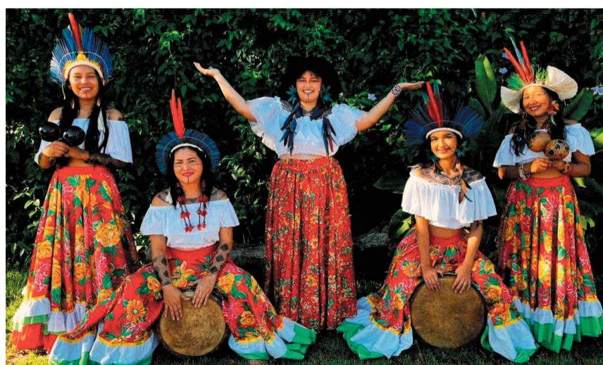
Die indigenen Künstlerinnen des Volkes der Borari bringen Musik, Tanz und politisches Engagement an den Bodensee.

Das Programm umfasst mehrere Veranstaltungen: Am Freitag, den 26. Juni, stellen As Karuana im Café Mondial von 18 bis 20 Uhr die Welt der Borari vor. Am Samstag, den 27. Juni, treten sie ab 18 Uhr in der Konzertmuschel im Stadtgarten beim Benefizkonzert der Trinkwasser-Initiative Konstanz auf. Als Rahmenprogramm gibt es am Sonntag, den 28. Juni, um 15 Uhr eine musikalische Amazonasreise für Familien im Palmenhaus Paradies, und um 19 Uhr geben As Ka-