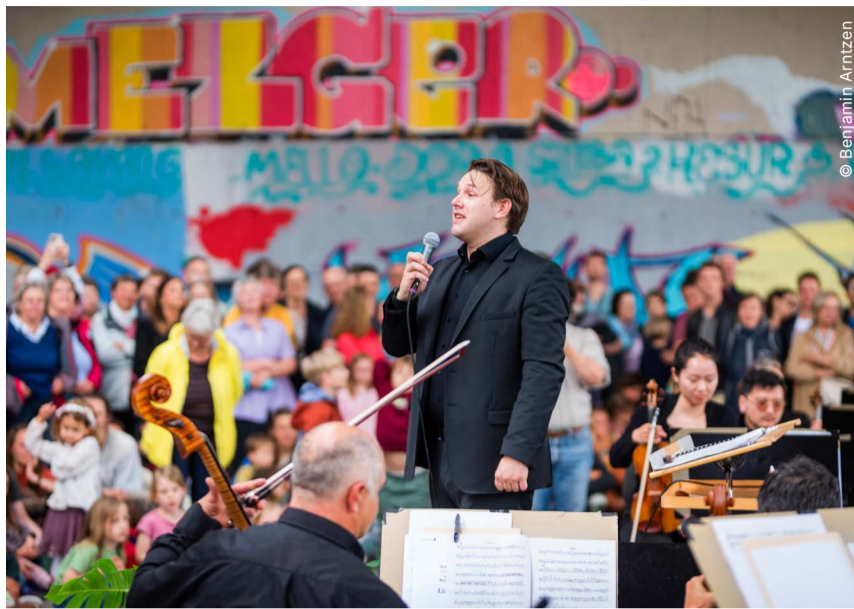
Mit dem Projekt „Zukunftsmusik“ hat die Bodensee Philharmonie bewusst den Konzertsaal verlassen und Räume in der Stadt musikalisch bespielt.

Zukunftsmusik hat sich als Raum für neue Perspektiven und innovative Zugänge zur klassischen Musik etabliert. Konzerte an besonderen Orten, interdisziplinäre Formate und die Zusammenarbeit mit PartnerInnen aus unterschiedlichen gesellschaftlichen Bereichen zeigen, wie Musik