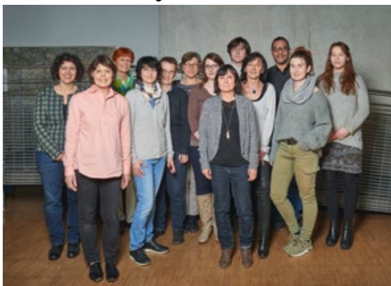
Das Team der Stadtbibliothek heißt Sie herzlich willkommen