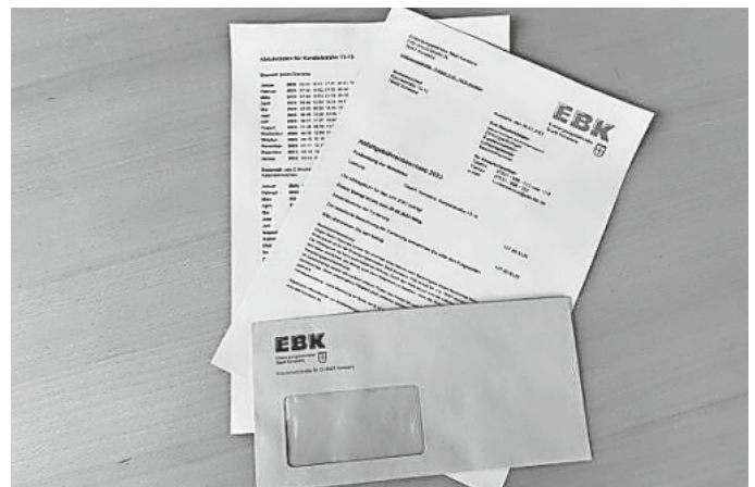
EBK Abfallgebührenbescheid 2023

Die Vorschläge der EBK werden in der kommenden Sitzung des Technischen Betriebsausschusses am 23.03.2023 im Ratssaal öffentlich diskutiert. Die Sitzungsvorlage inklusive Stellungnahme des Deutschen Mieterbundes ist bereits öffentlich zugänglich. Am 30.03.2023 liegt die Vorlage dem Gemeinderat vor, dessen Beschluss die EBK beauftragen kann, bis zum Jahresende ein neues Abfallgebührensysteem auszuarbeiten. Damit wäre die grundsätzliche Umstellung des Systems zum Jahreswechsel 01.01.2026 möglich.