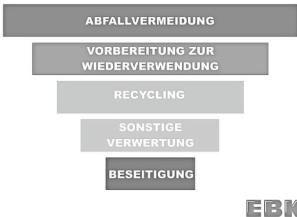
Die fünfstufige Abfallhierarchie des Kreislaufwirtschaftsgesetzes