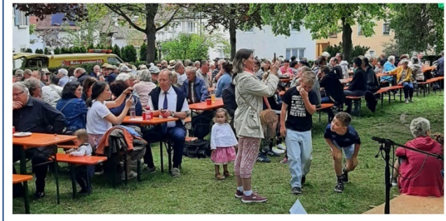
Bilder: Jutta Döring