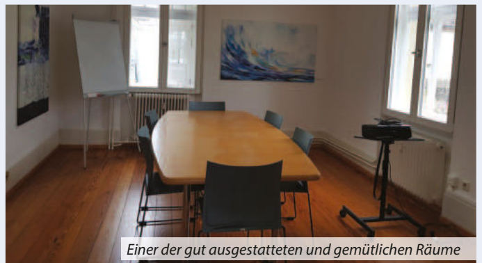
Einer der gut ausgestatteten und gemütlichen Räume