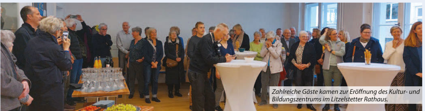
Zahlreiche Gäste kamen zur Eröffnung des Kultur- und Bildungszentrums im Litzelstetter Rathaus.