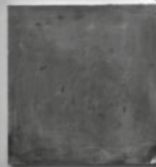
Fotografie Jürgen Ritter, ohne Titel, 2022