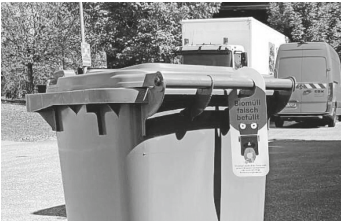
Der Bioabfall ist falsch befüllt und wird nicht geleert.

Auf der Aktionswebsite sind auch die nächsten Veranstaltungen verzeichnet: Am 10.10. laden die EBK zu einem Blick hinter die Kulissen, um 17.00 Uhr auf dem Betriebsgelände in Konstanz. Die Teilnahme ist kostenfrei, um Anmeldung ( steuerer@ebk-tbk.de ) wird gebeten.