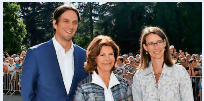
Königin Silvia von Schweden bei ihrem letzten Besuch auf der Insel Mainau.

Für die Besucherinnen und Besucher der Insel Mainau gibt es zwischen 13:30 und 14:00 Uhr die Möglichkeit, der Königin sowie der Gräflichen Familie Bernadotte im Schlosshof zu begegnen.