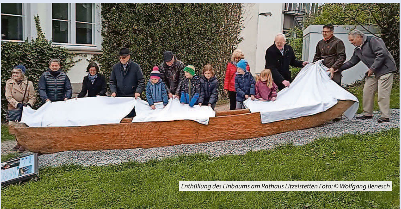
Enthüllung des Einbaums am Rathaus Litzelstetten

Gemeinsam mit dem Bronze-Alpenrelief vor dem Rathaus und der kleinen Pfahlbau-Ausstellung im Rathaus-Foyer trägt der Litzelstetter Einbaum jetzt zur Würdigung des UNESCO-Welterbes „Prähistorische Pfahlbauten um die Alpen“ und unserer Welterbestätte Litzelstetten-Krähenhorn bei.