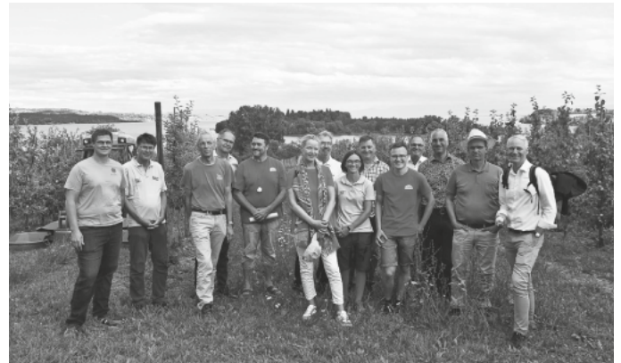
Viel Prominenz bei der Besichtigung des Modellprojekts „Biodiv Bodanrück“ am 3. August 2023

Das Modellprojekt „Biodiv Bodanrück“ läuft noch bis Ende 2024. Entstanden ist das Projekt durch die Kooperation von Naturschützern und Obstbauern, die sich gemeinsam den Herausforderungen stellen wollen, die sich bei der gleichzeitigen Förderung der Artenvielfalt, dem Schutz von Naturräumen und dem Erhalt der regionalen Lebensmittelproduktion ergeben. Projektbeteiligt sind lokale Obstbaubetriebe (Obsthof Romer, Fuchshof und Obsthof Honsel), Naturschutzverbände, Biologen und die Mainau GmbH als Leadpartner des Projekts. Des Weiteren findet eine Kooperation mit dem Landschaftserhaltungsverband Konstanz (LEV) statt, der unter anderem Landschaftspflegemaßnahmen im Projektgebiet koordiniert.