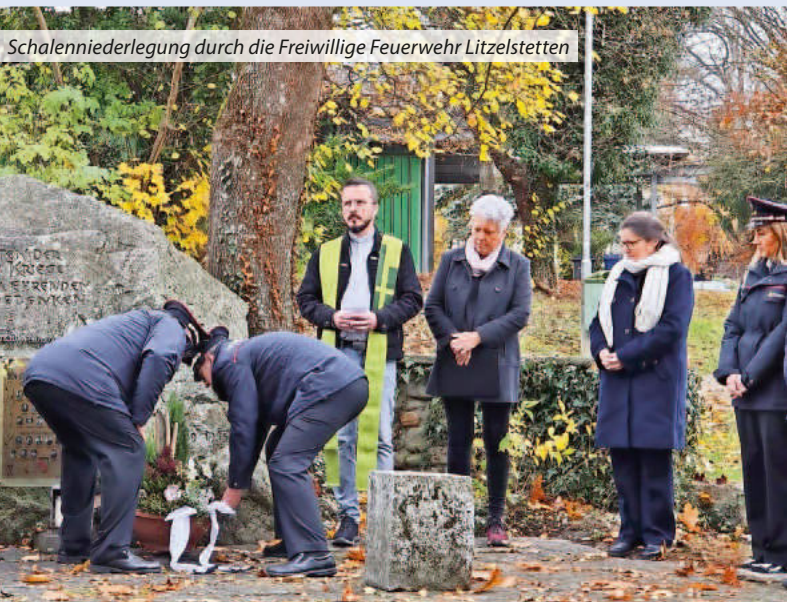
Schalenniederlegung durch die Freiwillige Feuerwehr Litzelstetten

Der Volkstrauertag ist ein Tag der Erinnerung, der Trauer – und der Verantwortung. Er ruft uns dazu auf, das Leid vergangener Generationen nicht zu vergessen und uns zugleich für Frieden und Menschlichkeit im Heute einzusetzen.