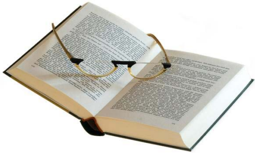
Buch mit 360 Seiten

Was hat den größeren CO 2 -Fußabdruck, ein gedrucktes Buch oder ein E-Book?