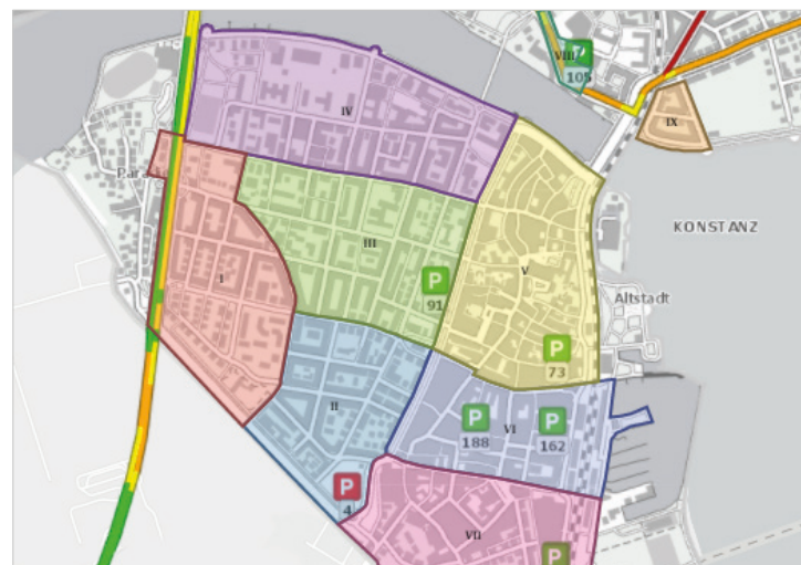
Парковочные зоны для жильцов района Paradies и подземные парковки.

Жить и работать по другую сторону озера – не проблема. 15 минут занимает поездка на автомобильном пароме из города Meersburg в Констанц или из района Wallhausen в город Überlingen, 50 минут займет поездка на пассажирском катамаране из города Friedrichshafen.