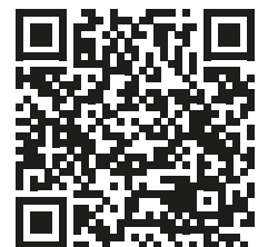
Парковки города и свободные места

В 2019 году город Констанц объявил о бедственном положении окружающей среды. Транспортная политика города направлена на сокращение автомобильных поездок по городу и развитие экологичных видов транспорта.