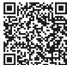
Перехватывающая парковка (P&R)

Для жителей города Констанц экологичные виды транспорта всегда были в приоритете. С 2007 по 2018 год количество поздок на автомобиле по городу сократилось на 10% и достигло 31%.