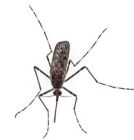
Heimische Ringelmücke ( Culiseta annulata )

Ein ähnliches streifenförmiges Muster findet man bei der heimischen Ringelmücke ( Culiseta annulata ). Diese ist jedoch deutlich größer (1-1,3 cm), hat dunkle Flecken auf den Flügeln und ihr fehlt die silbrig-weiße Linie auf Kopf und Brust.