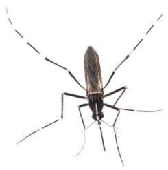
Asiatische Tigermücke ( Aedes albopictus )

Die Asiatische Tigermücke ( Aedes albopictus ) ist mit 2-10 mm im Vergleich zu einheimischen, gemeinen Stechmücken relativ klein und sogar kleiner als eine 1 Cent Münze. Auffällig ist das schwarz-weiß gestreifte Muster am ganzen Körper. An den Hinterbeinen befinden sich 5 weiße Streifen, das letzte Beinsegment ist weiß. Am Kopf verläuft mittig eine silbrig-weiße Linie, die sich am Brustteil fortsetzt. Die Flügel sind durchsichtig.