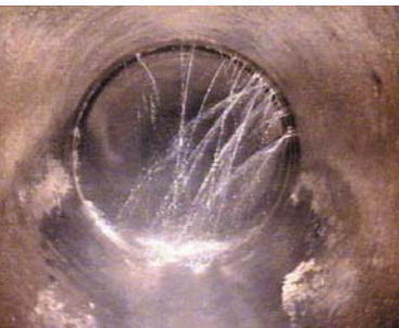
Undichte Rohrverbindung, Wasserzutritt

Tritt sauberes Grundwasser, auch Fremdwasser genannt, in die Abwasserleitung ein, erhöht sich der Abfluss im öffentlichen Kanalnetz. Die Abwasserreinigungs- und Betriebskosten steigen – und damit auch die Abwassergebühr. Außerdem kann es zu Rückstauproblemen kommen.