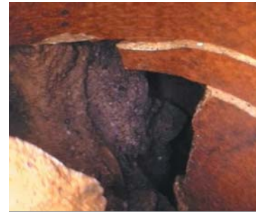
Fehlendes Rohrstück, Hohlraum sichtbar