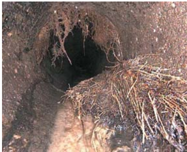
Wurzeleinwuchs an undichter Rohrverbindung

Tritt sauberes Grundwasser, auch Fremdwasser genannt, in die Abwasserleitung ein, erhöht sich der Abfluss im öffentlichen Kanalnetz. Die Abwasserreinigungs- und Betriebskosten steigen – und damit auch die Abwassergebühr. Außerdem kann es zu Rückstauproblemen kommen.