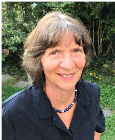
Aleida Assmann

„Es ist das Anliegen dieses Buches, die Flucht-Geschichten aus der Perspektive der Betroffenen zu schildern und dabei ihre konkreten Erfahrungen und Emotionen in den Mittelpunkt zu rücken. Mit jedem Text teilt sich den LeserInnen mit, wie isoliert, exponiert und von aller Welt verlassen sich die Flüchtenden fühlen.“ Nach einer Einführung durch die angesehene Literatur- und Kulturwissenschaftlerin Aleida Assmann lesen SchauspielerInnen des Theaters Konstanz Texte von Menschen, die nach 1933 ihre Heimat verlassen mussten und in der Fremde eine Zuflucht suchten. Autobiografische Berichte, Gedichte und Reflexionen u.a. von Georg Stefan Troller, Günther Anders, Hans Sahl, Irmgard Keun, Joseph Roth und Hannah Arendt und unbekanntem AutorInnen.