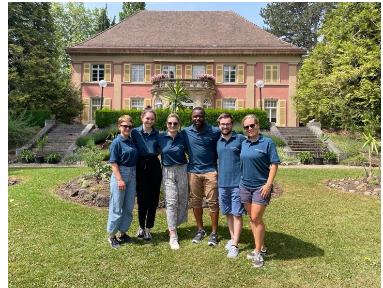
Ihr Team der Stabsstelle Konstanz International

Anregungen für unsere Arbeit und Kooperationsanfragen nehmen wir gern jederzeit per Mail entgegen an: International@Konstanz.de