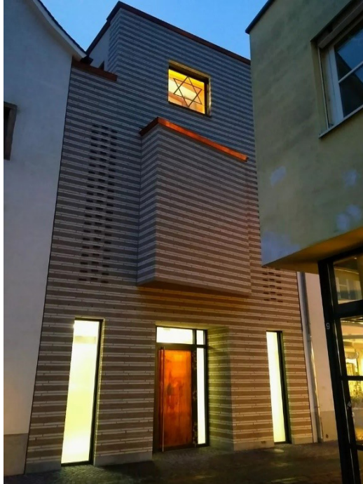
Synagoge Konstanz.

Die Synagogengemeinde Konstanz K.d.ö.R. ist als Einheitsgemeinde der Israelitischen Religionsgemeinschaft Baden (IRG Baden) untergeordnet. Über 300 jüdische Gemeindemitglieder fühlen sich bei ihr zu Hause. Die Gemeinde vertritt nach Innen und Außen als öffentliche Institution die Belange der Jüdinnen und Juden in Konstanz und dem Bodenseekreis. Bei den Führungen erfahren Sie Wissenswertes über die Gemeinde, das Judentum, die Konstanzer Synagoge und deren Geschichte.