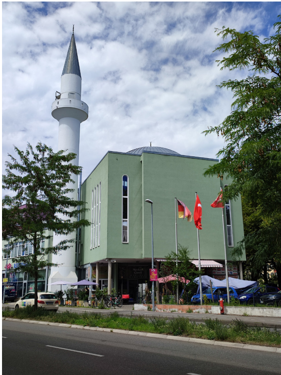
DITIB Mevlana Moschee Konstanz

Die DITIB Mevlana Moschee Konstanz öffnet zum bundesweiten Tag der offenen Moschee ihre Türen. Die BesucherInnen erwarten tolle süße und salzige Speisen sowie die Möglichkeit zu Führungen durch die Moschee. Diese finden stündlich zwischen 11:00 und 17:00 Uhr zur vollen Stunde statt.