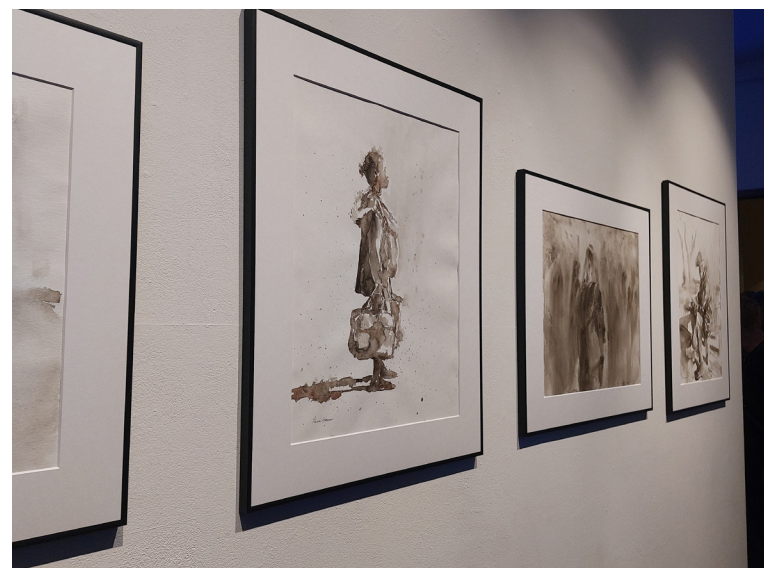
Aquarellzeichnungen des Künstlers Reza Ghanei

Reza Ghanei, ein iranischer Künstler, lebt und arbeitet in Konstanz. Im Rahmen der Interkulturellen Woche Konstanz 2023 führt Reza Ghanei in die Kunst der Aquarell-Malerei ein. Alle notwendigen Materialien für den Workshop stehen zur Verfügung. Ob Groß oder Klein, alle Interessierten sind herzlich zum Workshop eingeladen.