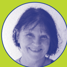
Petra Asal Werkbereich, Spiel- und Zirkuspädagogik