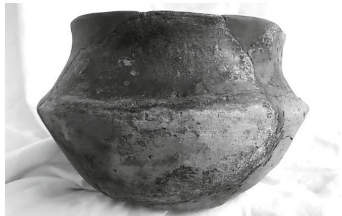
Seltene Horgener Knickwandschale

Die nachfolgende „Horgener Kultur“ 3400-2800v.Chr. entwickelte sich bruchlos aus der vorangegangenen Pfyner Kultur. Die Pfahlbaustation Horgen am Zürichsee war namensgebend. In der Keramikherstellung im Horgen gab es einen deutlichen Rückschritt gegenüber der Pfyner Perio-