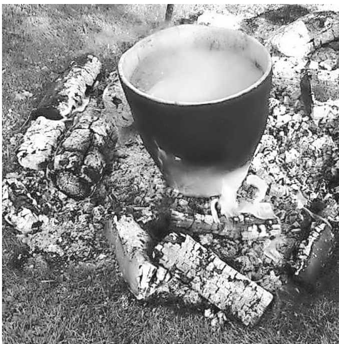
Nachgetöpferter „Horgener Kochtopf“, den wir für unsere Steinzeit-Dinner zum Kochen verwenden

Getreidearten wie Emmer, Dinkel, Einkorn, Hafer, Nacktweizen, sowie Erbsen, Bohnen und Linsen wurden zu einem schmackhaften Eintopf verkocht. Mit Waldpilzen, Wildkräutern und Rehrücken wurde der Gaumenschmaus vervollständigt.