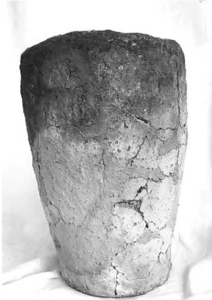
Besonders großer Horgener Kochtopf mit einer Höhe von 46cm und einer Breite von 29 cm, er hat ein Fassungsvermögen von 18 Liter.

Nach einem Wintersturm im Januar 2001 dachte ich an einen weggeworfenen Eimer, der im Untergrund steckte. Bei näherer Untersuchung des mit Algen überwachsenen Eimers stellte sich dieser als nahezu vollständiger, besonders großer 5000 Jahre alter Horgener Kochtopf heraus.