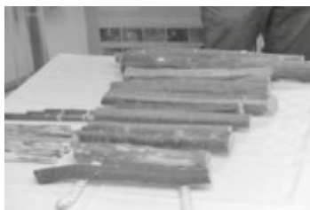
So könnte ein steinzeitliches Xylophon aus Ästen ausgesehen haben

Neben den Bienen, gab es dieses Wochenende auch die Möglichkeit einen steinzeitlichen Workshop zum Thema Musik in der Steinzeit zu besuchen.