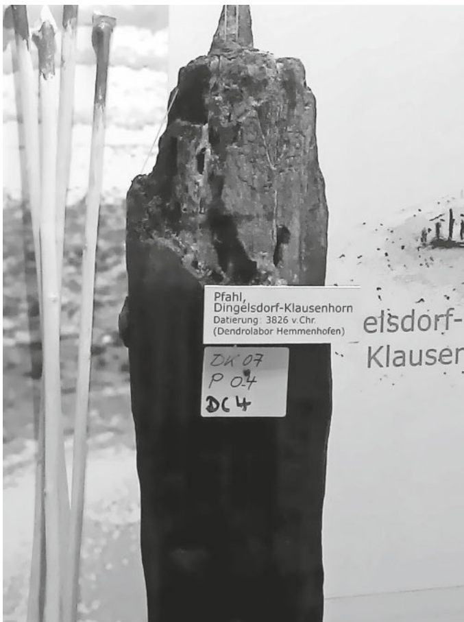
Dendrochronologisch datierter Pfahl aus der Pfahlbau-Siedlung Klausenhorn - 3826 v. Chr.