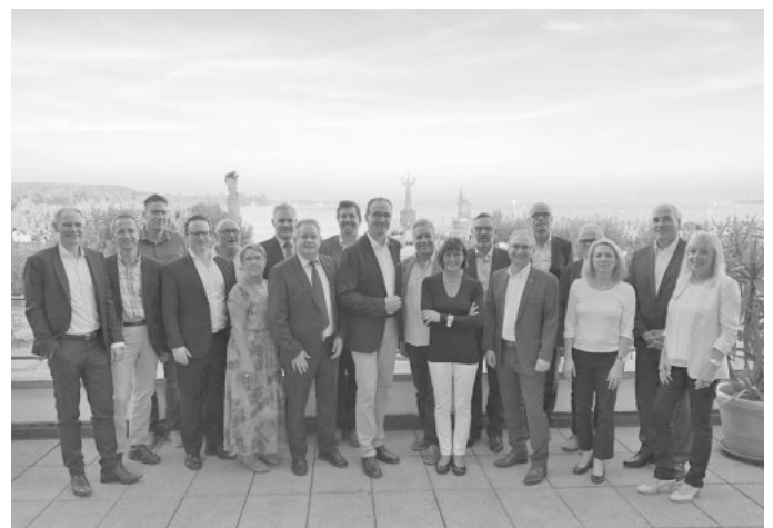
Die Stadtspitzen von Konstanz, Kreuzlingen und Tägerwilen bei der Grenzlandkonferenz auf der Terrasse des Konstanzer Konzils

Ein weiteres Problem sehen die Städte und Gemeinden im LKW-Stau am Montagmorgen. Die für die Lastwagen vorgesehenen Stauräume – so wie an der Claude-Dornier-Straße (73 Stellplätze) – reichen nicht aus und werden von ordnungswidrig parkenden Autos blockiert. So stauen sich montagmorgens LKWs an der Europastraße bis über die neue Rheinbrücke in die Reichenaustraße hinein. Verstärkte Kontrollen und Abschleppen von Falschparkern sowie zusätzlicher Vorstauraum samt Zufahrtskontrolle sollen Abhilfe schaffen.